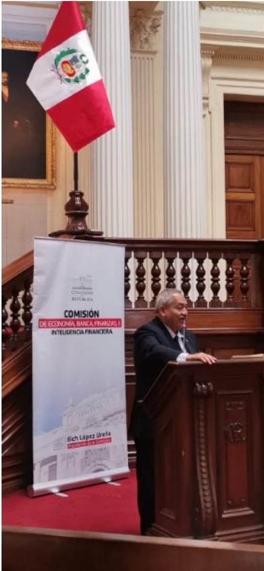
Congresista Víctor Flores Ruiz - Miembro de la Comisión de Economía Banca Finanzas e Inteligencia Financiera