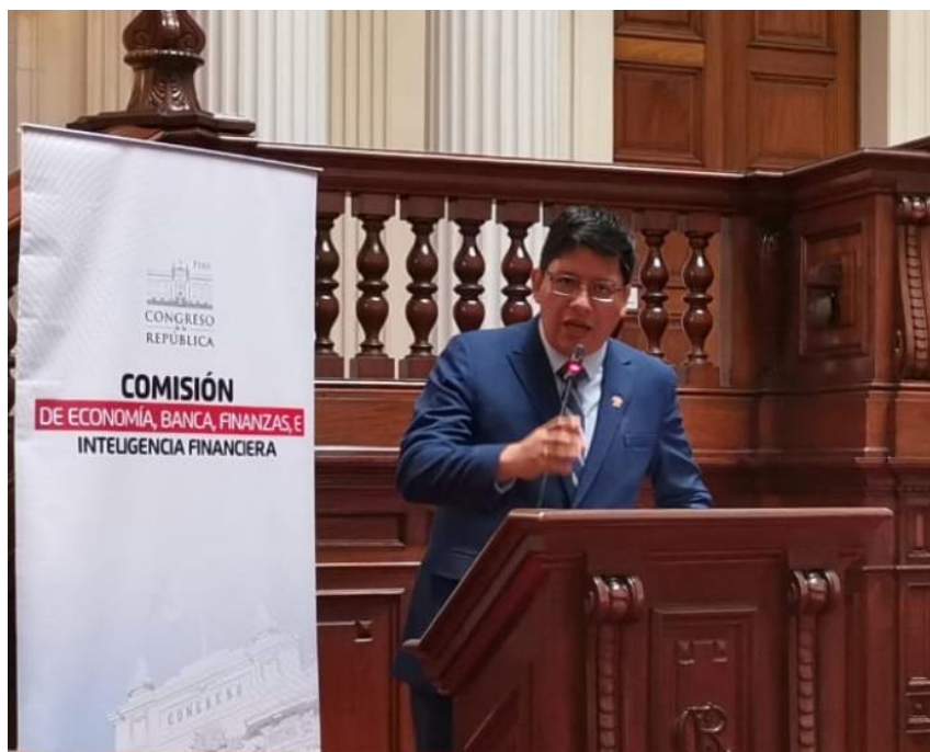
Congresista Ilich López Ureña - Presidente de la Comisión de Economía Banca Finanzas e Inteligencia Financiera